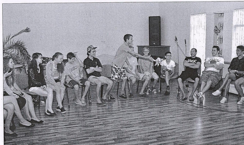
GRUPA. Mūzikas terapijā kopā ar Valmieras SOS bērniem piedalījās arī vairāki Norvēģijas jaunieši.