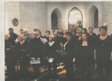
PROSJEKTOR: Et eget prosjektkor var stiftet for anledningen. Etter fire øvinger ble det bra resultat i Birkeland kirke.