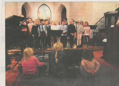
SMÅ OG STORE: Både små og store publikummere koste seg med konserten. Her ser tre ivrige tilskuere på Steinerskolens opptreden.