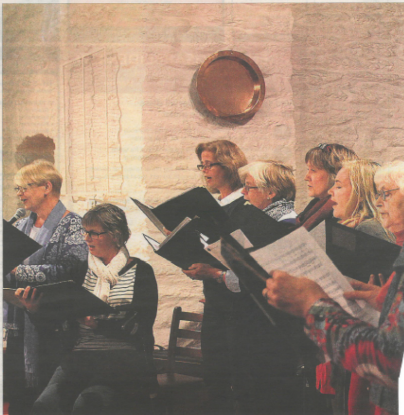
ØYKTIGE: Medlemmer fra Birkeland kantori strøe opp og sang «Se på vår jord»

Det ble en melankolisk og varm musikalsk aften med et mangfoldig utvalg av bidragsytere. Stiftelsen Sesam har i lang tid ladet opp til konserten ved å få frivillige kle opp trær og stolper med kjeder de har strikket selv. Et mobil kunst-